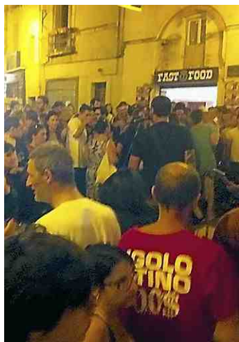
Soir de semaine, dans l'Écusson.

« On ne peut interdire aux gens de se regrouper à l'extérieur pour fumer. » Autant agir dans le domaine du possible, faire déguerpir la multitude ou lui demander de retourner à l'intérieur. Quand l'établissement en question peut tout juste en contenir 50, autant faire