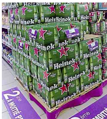
Evidemment... c'est tentant !

Les fameux bars-debout dont les plus impressionnants se situent « à l'heure actuelle rue du Pila Saint Gély, Saint-Roch ou rue Boussairolles », posent aussi un enjeu de taille, celui de la santé publique des administrés, pour lequel le maire ferait la sourde oreille, négligeant au passage la descente de